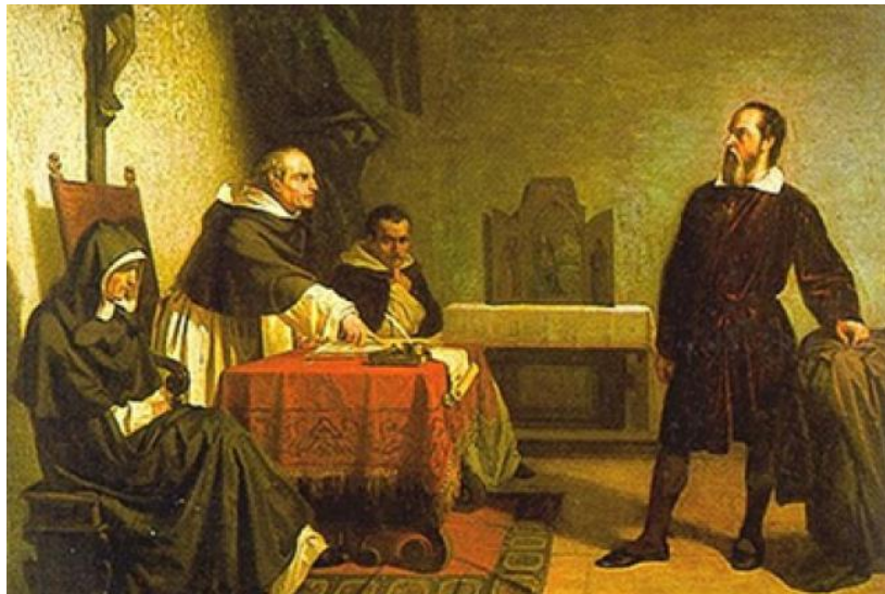
Juicio a Galileo Galilei

En el siglo XVII, en 1633, Galileo Galilei fue juzgado por el Tribunal del Santo Oficio o Tribunal de la Inquisición debido a que sus planteamientos sobre el heliocentrismo eran contrarios a la doctrina de la Iglesia. Fue condenado a prisión y obligado a retractarse, según la tradición se atrevió a replicar con una frase célebre: “pero se mueve”.